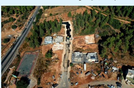
أنجز هذا الأسبوع بناء مبنى متعدد الاستخدامات في بلدة الضميده.